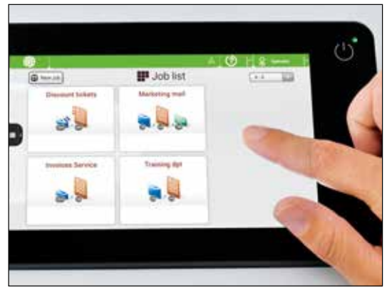
Bedienungsanleitung „an Bord“! 7“-Farb-Touchdisplay und intuitive, mehrsprachige Menüführung machen die Bedienung kinderleicht.